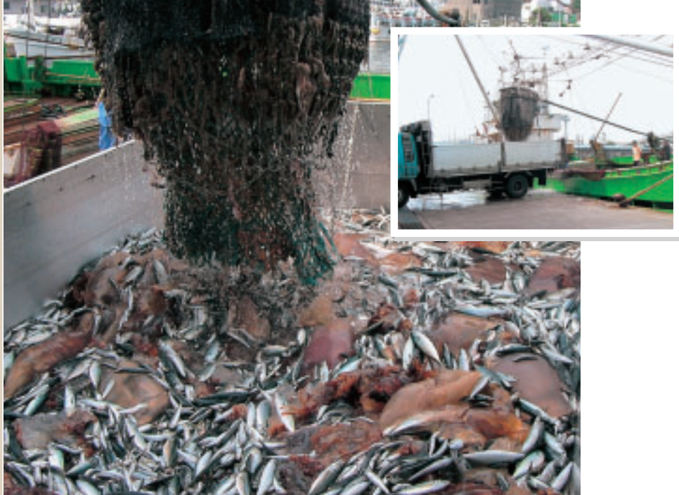
漁獲物と混獲された大型クラゲ