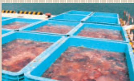
ストックヤードにおける大型クラゲ