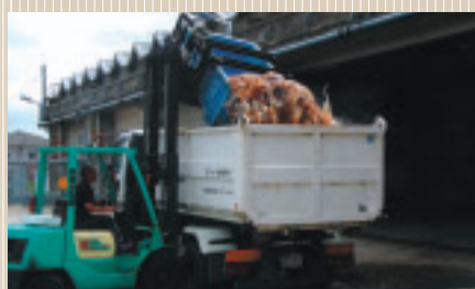
回転フォークリフトによる水密車への移し込み作業