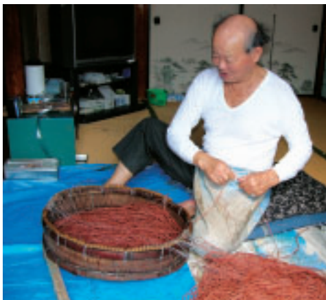
縄を繰るお父さん