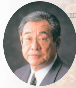
漁業協同組合JFしまね 代表理事会長