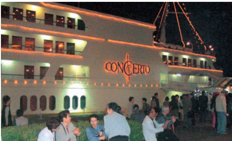
明石海峡ディナークルーズにて

JFマリンバンクしまねでは、今後とも会員の皆様にご喜んでもらえる企画や特典などを提供してまいりますのでご期待下さい。