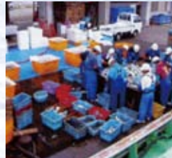
帰港後、すぐに魚の仕分け作業をし、冷却します。