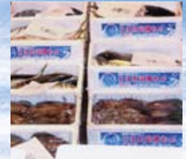
箱に認証シールを貼って、市場等に出荷します。