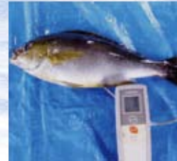
魚の体温を測ります。概ね5℃以下に保ちます。