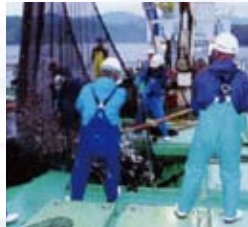
獲れた魚はすぐに殺菌冷海水の船倉に入れます。