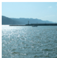
穏やかな時もあれば、激しい時もある。それもまた海の魅力だ。

港に帰って、捕れた魚を荷揚げします。大漁のときは大変だけど、嬉しさが先に来るので、疲れなんか感じませんよ！